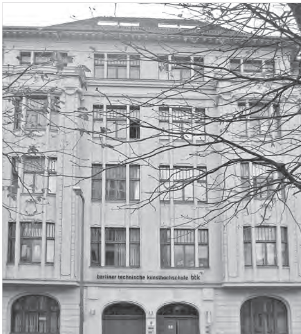
Abb. 1: Das Gebäude Bernburger Str. 24/25, heute Sitz der Berliner Technischen Kunsthochschule

Vor 100 Jahren, im Jahre 1912, erhielt der Deutsche Verein für Armenpflege und Wohlthätigkeit 1 seine erste Geschäftsstelle in der Bernburger Straße in Berlin. Seither ist sie mehrfach zwischen Berlin und Frankfurt a.M. hin- und herverlegt worden, 2 ihre Aufgaben sind enorm angewachsen und werden heute von fast 100 Mitarbeiter/innen bearbeitet. Das Jubiläum ist ein guter Zeitpunkt, um diesen – sowohl auf symbolischer wie auf materieller Ebene – historisch wichtigen Schritt auf dem Weg zur Professionalisierung des Deutschen Vereins zu betrachten. Vor allem aber soll es zum Anlass genommen werden, an die Frau zu erinnern, die die erste Geschäftsführerin war.